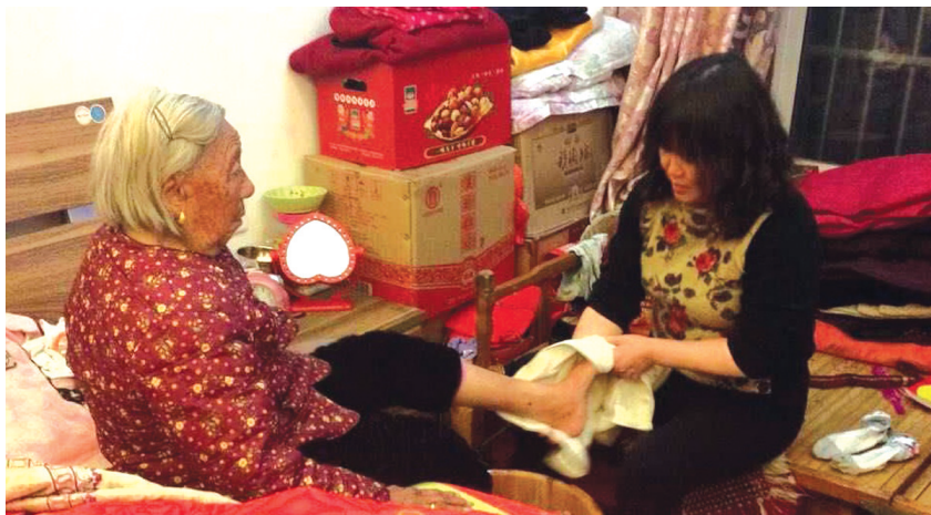
尚改风给婆婆洗脚