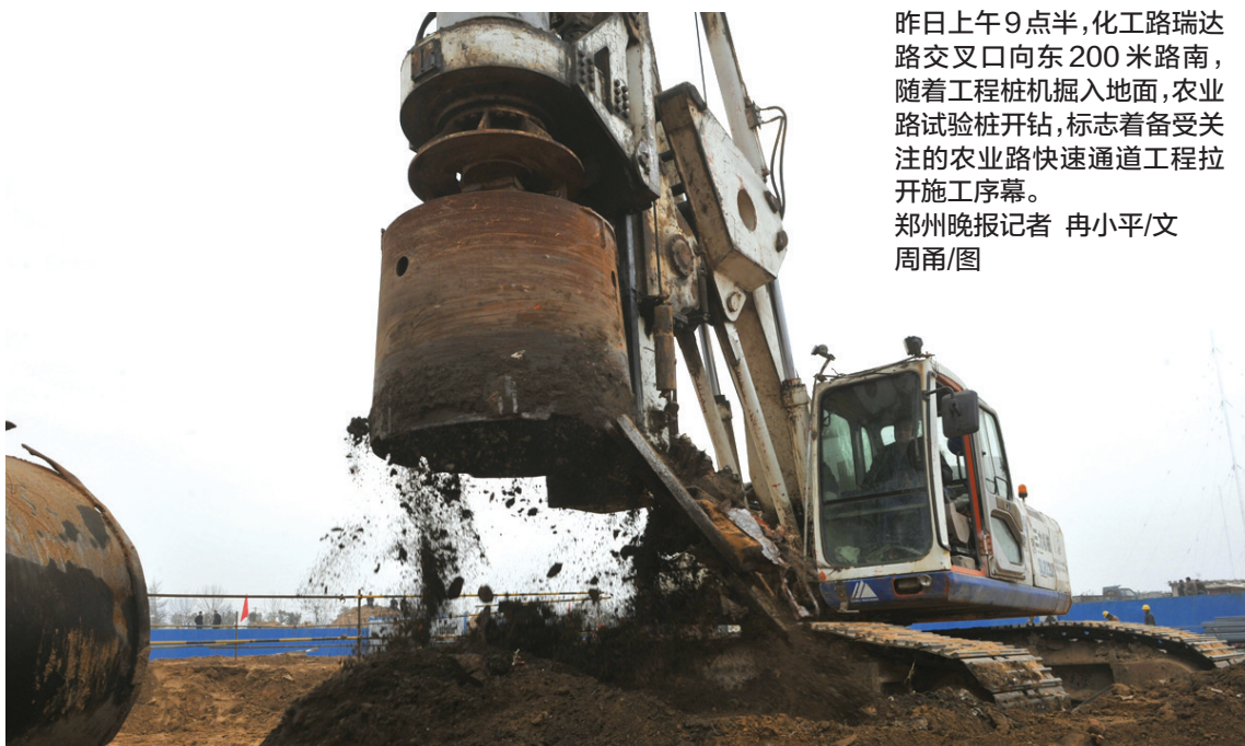
昨日上午, 瑞达路与化工路交叉口, 随着钻机开始下钻, 农业路高架正式开始动工。

预计3月初全线开工, 全线将设围挡, 但不断行 保通方案将及时公布, 让市民出行心中有数