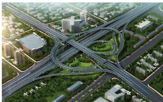
农业路与中州大道立交效果图