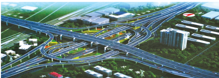
农业路与京广路高架互通立交效果图