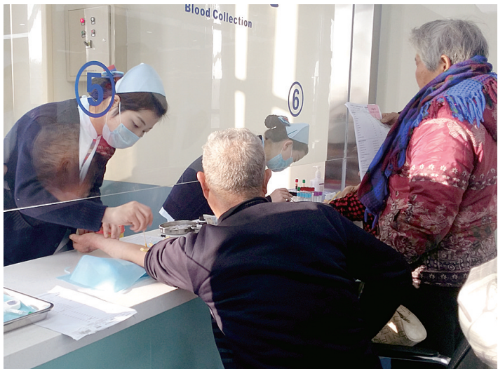
登封老人在接受免费体检