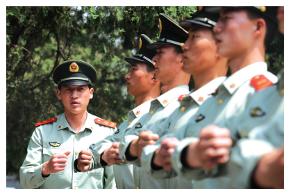
和战友们刻苦训练