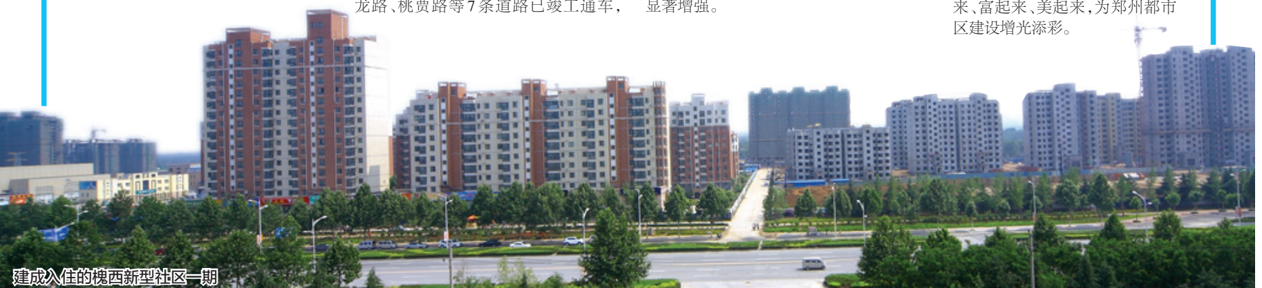
建成入住的槐西新型社区一期

郑州市新三年行动计划已经部署,豫龙镇今后3年的发展蓝图也已谋划,这块天下客商投资兴业的宝地热土,必将集聚大量人流、物流、资金流和信息流。下一步,豫龙镇将围绕工业强镇主战略,依托荥阳市产业集聚区发展载体,以项目建设、棚户区改造和基础设施建设“三个切入点”为重点,狠抓现代装备制造体系建设,把握大局,在发展思路求提升;善做善成,在工作质量求提升;高标定位,在为民服务上求提升,不断开创新常态下豫龙镇经济社会发展新局面,让豫龙更加强起来、富起来、美起来,为郑州都市区建设增光添彩。