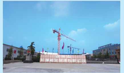
长城机器制造有限公司

时值年末岁首,回顾过去厉兵秣马、砥砺奋进的三年,在郑州市三年行动计划的引领下,豫龙镇也迎来了经济社会发展的辉煌三年。特别是在郑州经济发展格局中,豫龙镇以良好的区位优势和发展潜力,承担了新的发展引擎的角色,围绕“三大主体”工作,爬坡过坎、务实重干,绘就了经济腾飞、社会和谐的美好画卷。