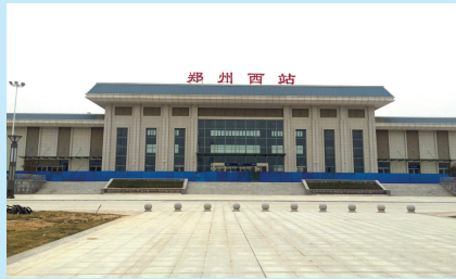
建成即将启用的郑西高铁郑州西站