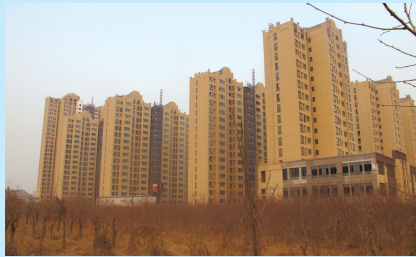
建成即将入住的石柱岗社区