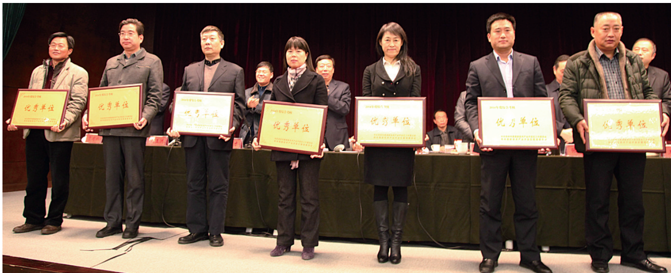
高新区部分单位获得表彰

1月30日,高新区召开全区2014年总结表彰暨2015年工作部署大会。学习贯彻党的十八大、十八届三中、四中全会和中央、省委、市委经济工作会议精神,全面总结2014年工作,安排部署2015年的主要工作。高新区将2015年定为“科技城市建设攻坚年”,着力“破瓶颈、夯基础、铸优势、求提升”,为实现六星级产业集聚区目标、建设千亿科技城、跻身全国高新区第一方阵奠定坚实基础。 记者 鲁慧 实习生 孟刘奇 文/图