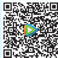
舌尖上的老家 “老家的味道”参赛作品