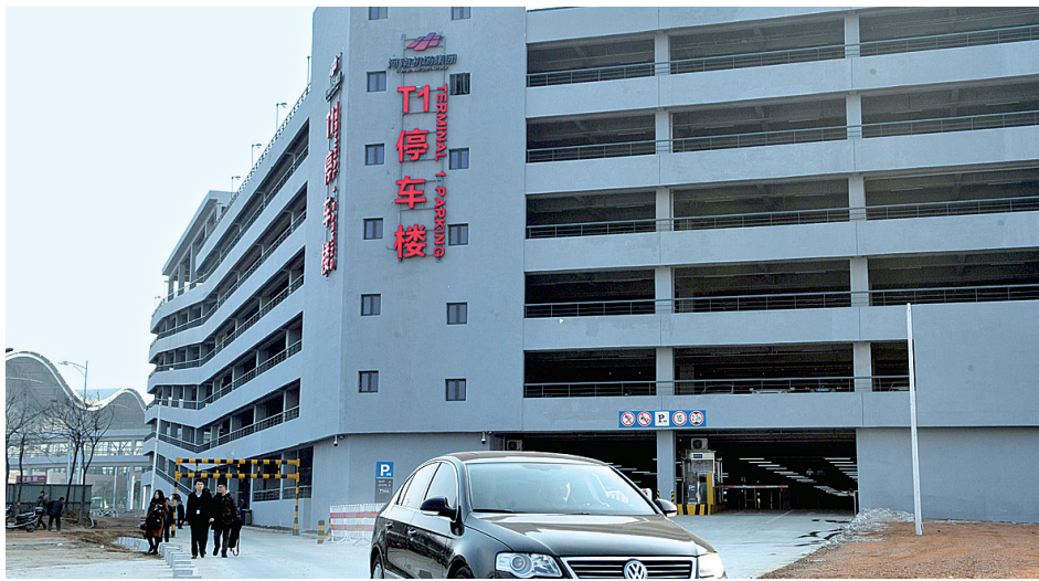
已经投入使用的新郑机场T1停车楼