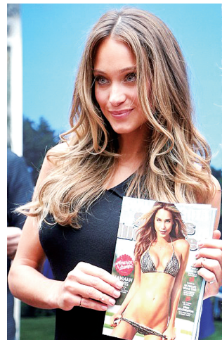
封面女郎汉娜·戴维斯