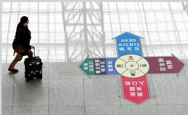
无论指示牌指向哪里,心的方向只有一个——回家。