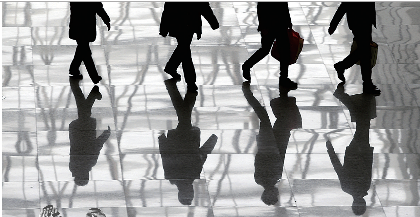
每年春节回家的路,是最想走的路,脚步匆匆,无心再看路上的风景。