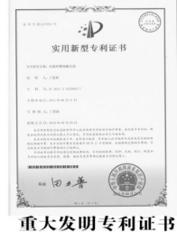
重大发明专利证书