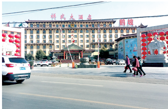
禅武大酒店文化广场

禅武大酒店文化广场入口处伫立了两个高大威武的汉白玉大象,大象分为文象、武象,借其谐音“吉祥”之意,祝福所有来宾:文成武就、吉祥如意。