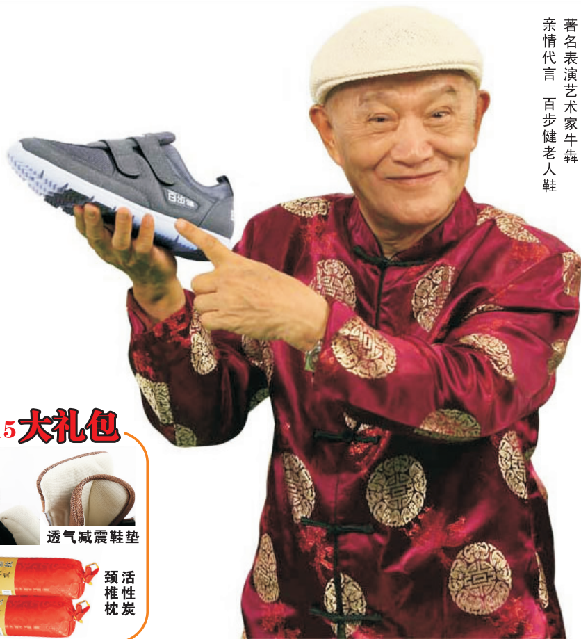
著名表演艺术家牛犇 亲情代言 百步健老人鞋

防滑、超轻、舒适、养生的“百步健老人鞋”已成为老年朋友春天旅游踏青不可或缺的出行之宝