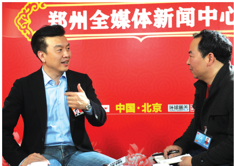
张泽群接受专访。