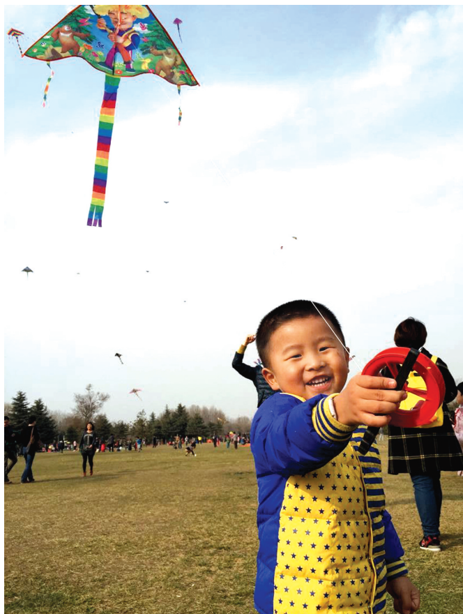
「放飞童趣」