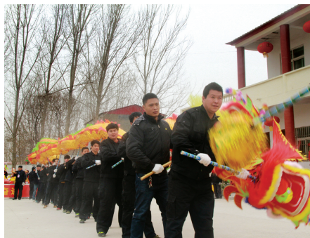
“舞出希望”