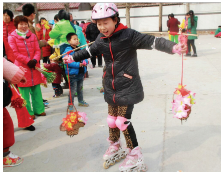
“新式挑花篮”