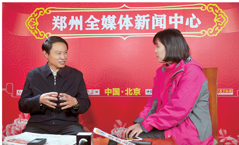
茅盾文学奖得主、南阳籍著名作家周大新接受郑州全媒体新闻中心专访