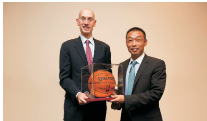
从左到右：NBA 主席亚当·萧华与蒙牛高级副总裁白瑛

除了推出此类定制包装牛奶产品外，蒙牛还将继续携手 NBA 在中国推广篮球运动和康活力的生活方式，并参与包括“NBA 国际系列赛事”、“NBA 新春贺岁”和“NBA 篮球国度”等活动，开展线上线下推广活动，实现在产品、消费者互动、新媒体传播等多个领域的合作升级，以吸引更多年轻消费群体的关注，推进蒙牛品牌年轻化，从而刷新年轻消费者心目中的蒙牛品牌形象。