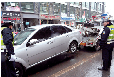
昨日上午,交警调来拖车,拖移京广快速路匝道上的违停车辆。