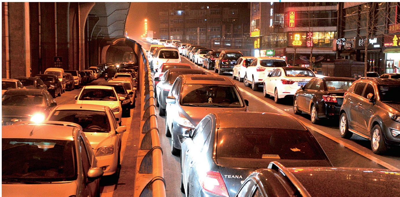
17日深夜,京广快速路上桥匝道上都停满了机动车。