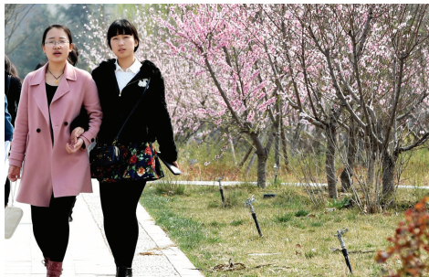
河南工业大学的桃花

盛放的花还有迎春花、连翘、金钟花，主要分布在眉湖南端小瀑布周围、亭云路北侧竹林边，以及厚山、柳园24号楼、樱花园附近。