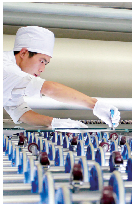
位于新郑的河南福鑫玻璃有限公司的工人正在生产防弹玻璃