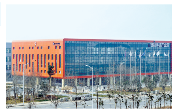
航空港区的智能终端(手机)产业园

生物医药产业园,目前卓峰二期、新众康建成投产;润弘制药正在建设;国药集团开工建设,同时已有4家企业意向入驻。 2014年,新郑新港产业集聚区实现规模以上工业增加值41.5亿元,同比增长19.6%;完成固定资产投资93亿元,同比增长30.8%;主营业务收入310亿元,增长18.2%;税收收入3亿元,增长28%;增加值41亿元,增长20%;从业人员达到18317人。