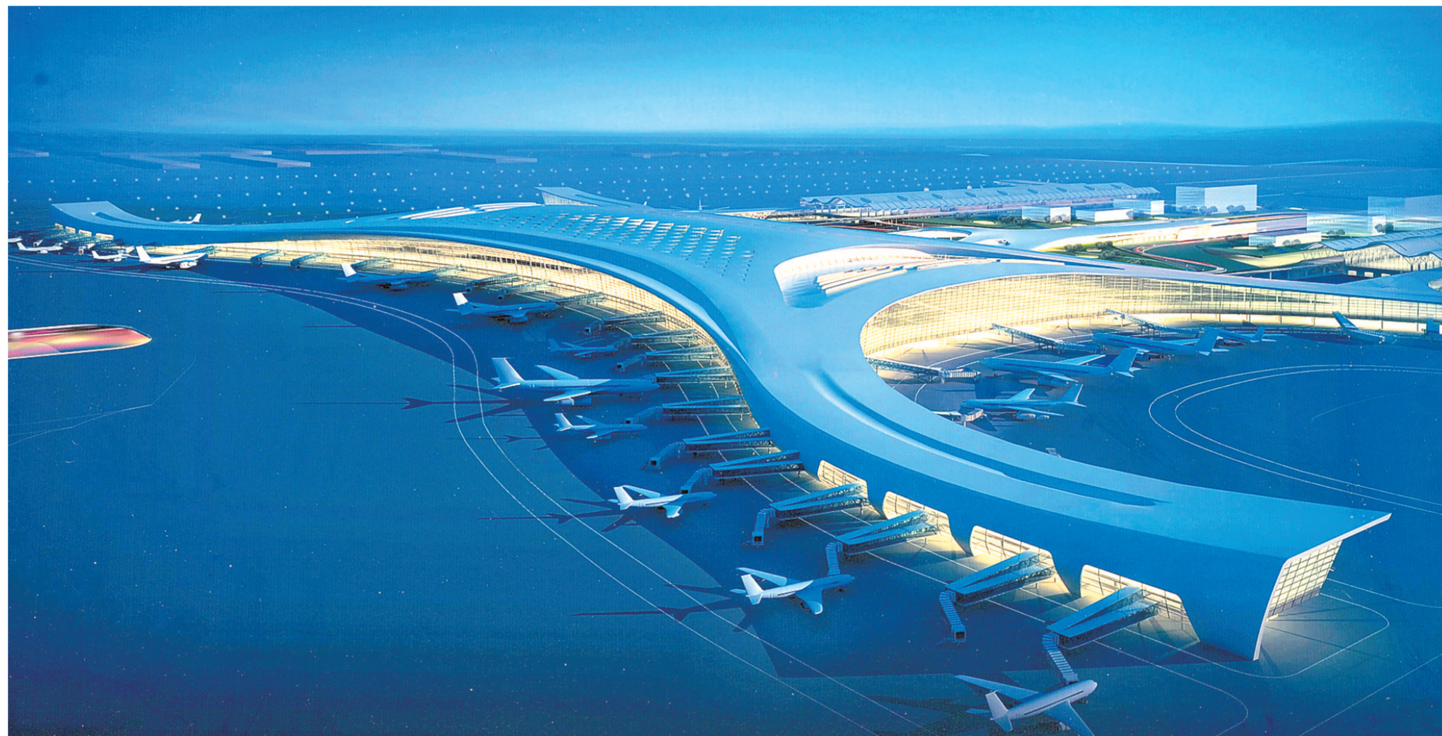
郑州新郑国际机场二期工程效果图(夜带)