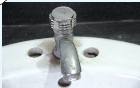
清洁前的不锈钢水龙头