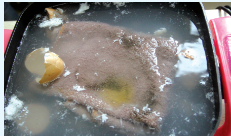
将生鸡蛋壳和抹布一起在锅里煮