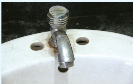
只用抹布擦洗过的不锈钢水龙头