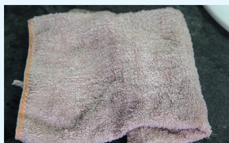
煮完后冲洗过的抹布