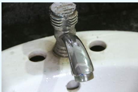
用土豆皮擦洗过的水龙头