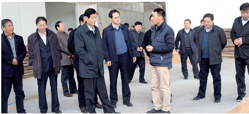
登封学习考察组在郑州市领导带领下赴原阳参观学习家居产业

据悉,原阳依托川渝商会家具分会,充分发挥比较优势,组合承接郑州及国内家具企业,形成了以金祥家具产业园为主导的家居产业集群,现已落地企业53家,完成投资39亿元,原阳家居产业的成功模式值得登封借鉴。学习考察组一行先后到原阳金祥家居产业园的河南十月家居有限公司、河南省顶好家具有限公司、河南维尼雅家具有限公司以及产业集聚区综合服务中心实地进行考察,并与原阳县有关负责人举行了交流座谈会,认真听取原阳在产业集聚区建设及家居产业发展方面先进经验的介绍。