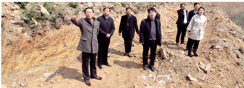
看到荒山栽上的核桃树,大家兴致勃勃。

近日,登封市政协主席孟永瑞一行10余人对登封市春季植树造林工作进行了调研,对登封市嵩阳办、卢店镇、告成镇、东华镇、君召乡等单位植树造林取得的成果给予肯定。随后,政协一行又对荒山造林进行了专门调研,颍阳镇方面介绍了该镇鼓励林地流转和企业、大户承包,培育核桃、梨等经济林的模式。孟永瑞表示,这种模式既美化环境,又给当地带来了经济收入,值得推广。