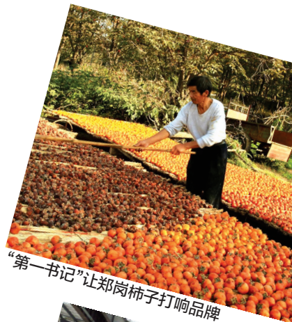
“第一书记”让郑岗柿子打响品牌