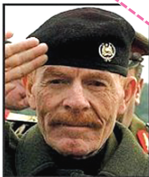
IZZAT IBRAHIM AL-DURI RCC Vice Chairman