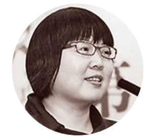
乔叶 (省作协副主席、作家)

八九了，人人办理年货，别人都大包小包往家里带年货，我推着一辆旧自行车回家，后座驮一大编织袋，母亲正在院里蒸馒头、洗海带，母亲也期待我能买一些年货吧。我回家了，从自行车上搬下来大编织袋，卸下来的是从上海邮购来的十卷本的硬壳《百科全书》。母亲无奈地笑了我，她宽宏地理解我。母亲都去世10年了，每每想起，就有点惘然。