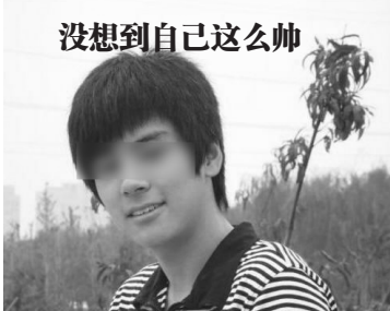
没想到自己这么帅

“光头剩男”小王就要结婚了，对象还是个大美女。然而，之前已经29的小王，因为遗传性脱发，头顶早就光秃秃了，搞对象见几个吹几个。