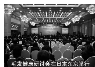
毛发健康研讨会在日本东京举行