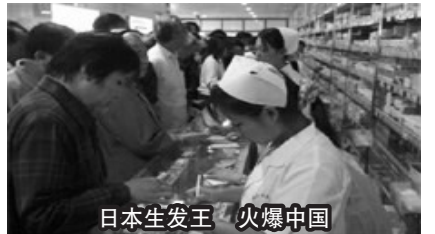
日本生发王 火爆中国

日本生发王一上市就受到脱发人士热捧！从来没有一个产品能像日本生发王一样，一喷上去，头皮马上不油不痒，7天脱发全面控制，30天再生满头黑发。日本生发王风头盖过所有的同类产品。