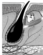
毛囊激活头发再生