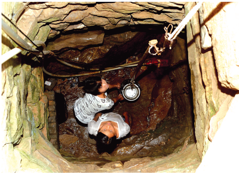
单幅类金奖作品《中原大旱》呈现出大旱来临时人们用水困难的情景。