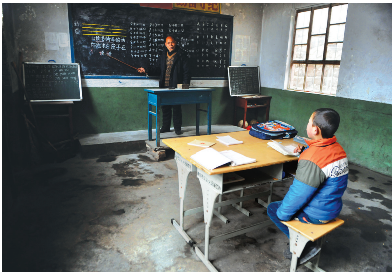
组照类金奖作品《大山深处的坚守》讲述的是一个学生一个老师和一座学校的故事。