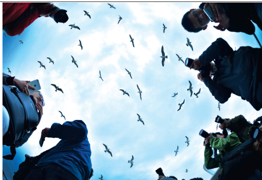
采风获奖作品《海驴岛竞技》