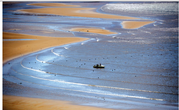
采风获奖作品《乳山海滩》