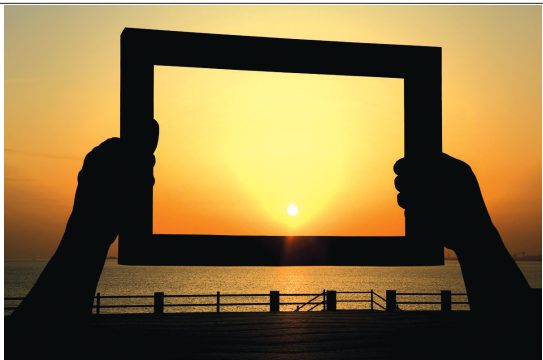
采风获奖作品《威海之窗》