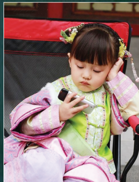
认出来了吗?剧中的“小公主”是《甄嬛传》里的温宜公主。