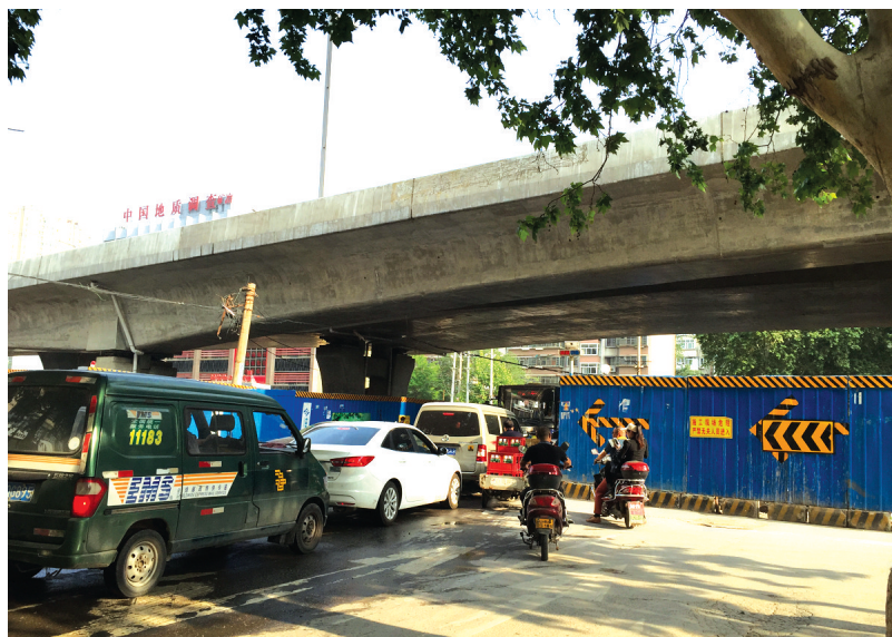
陇海路伏牛路口东西两侧封闭,车道变窄,车辆较为拥堵。