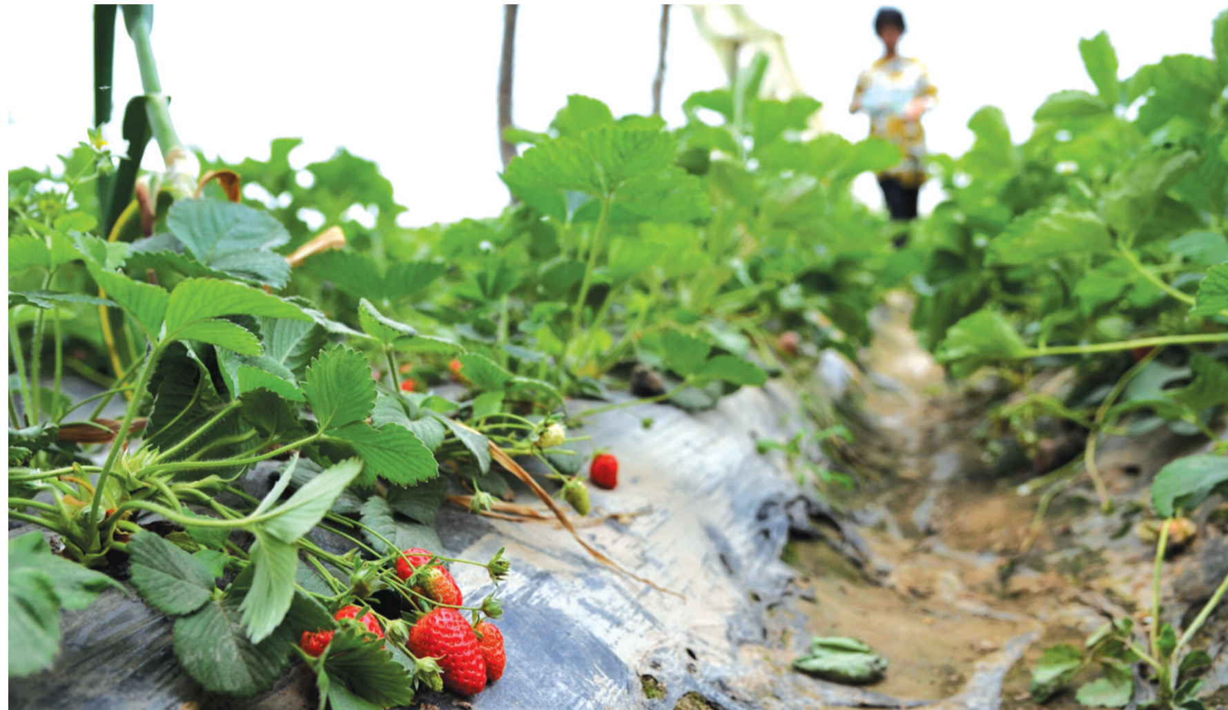
中牟刘集镇,农民大棚内种植的草莓