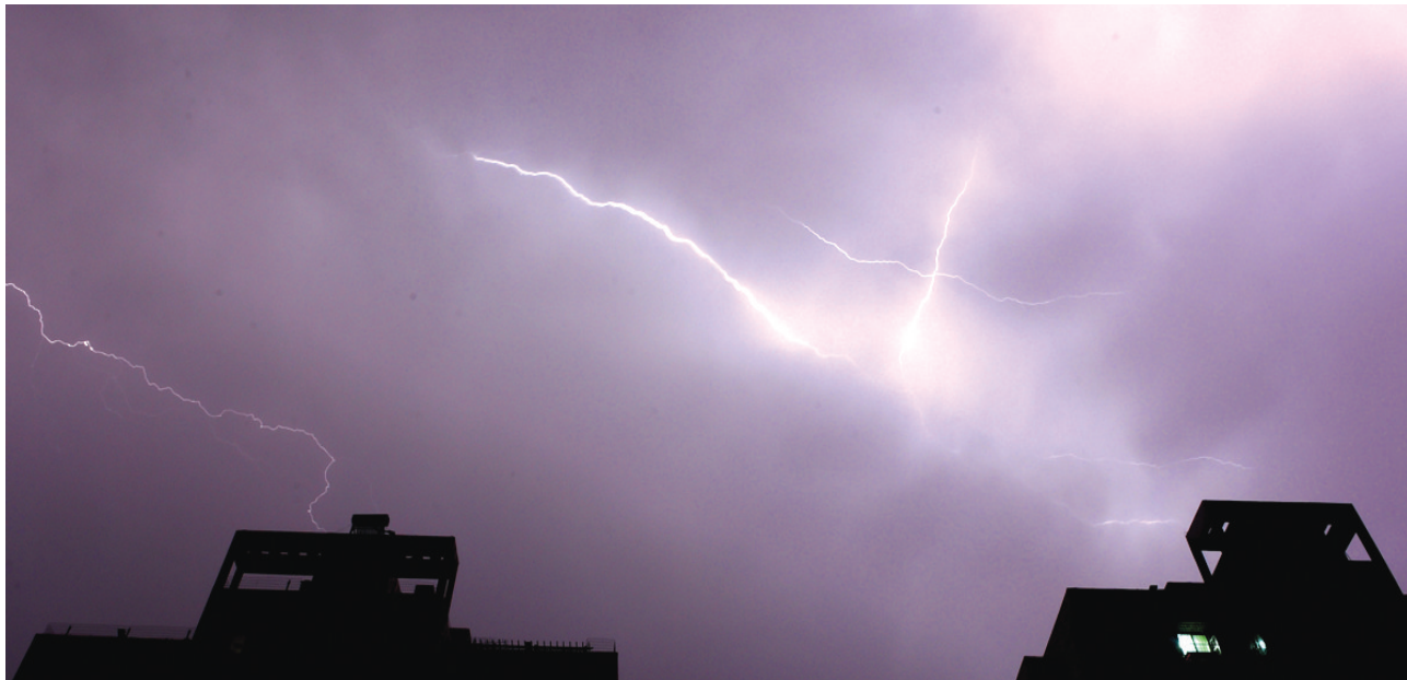
6日晚,郑州上空电闪雷鸣

前晚突如其来的一场强对流天气,给我省部分地区带来了风雹灾害。省民政厅的数据显示,截至昨日15时,经初步统计,全省受灾人口206.79万人,农作物受灾面积178.8千公顷,灾害造成我省直接经济损失9.58亿元。周口市西华县一名群众因树干倒塌不幸死亡。平顶山鲁山县房屋倒塌造成1人死亡。