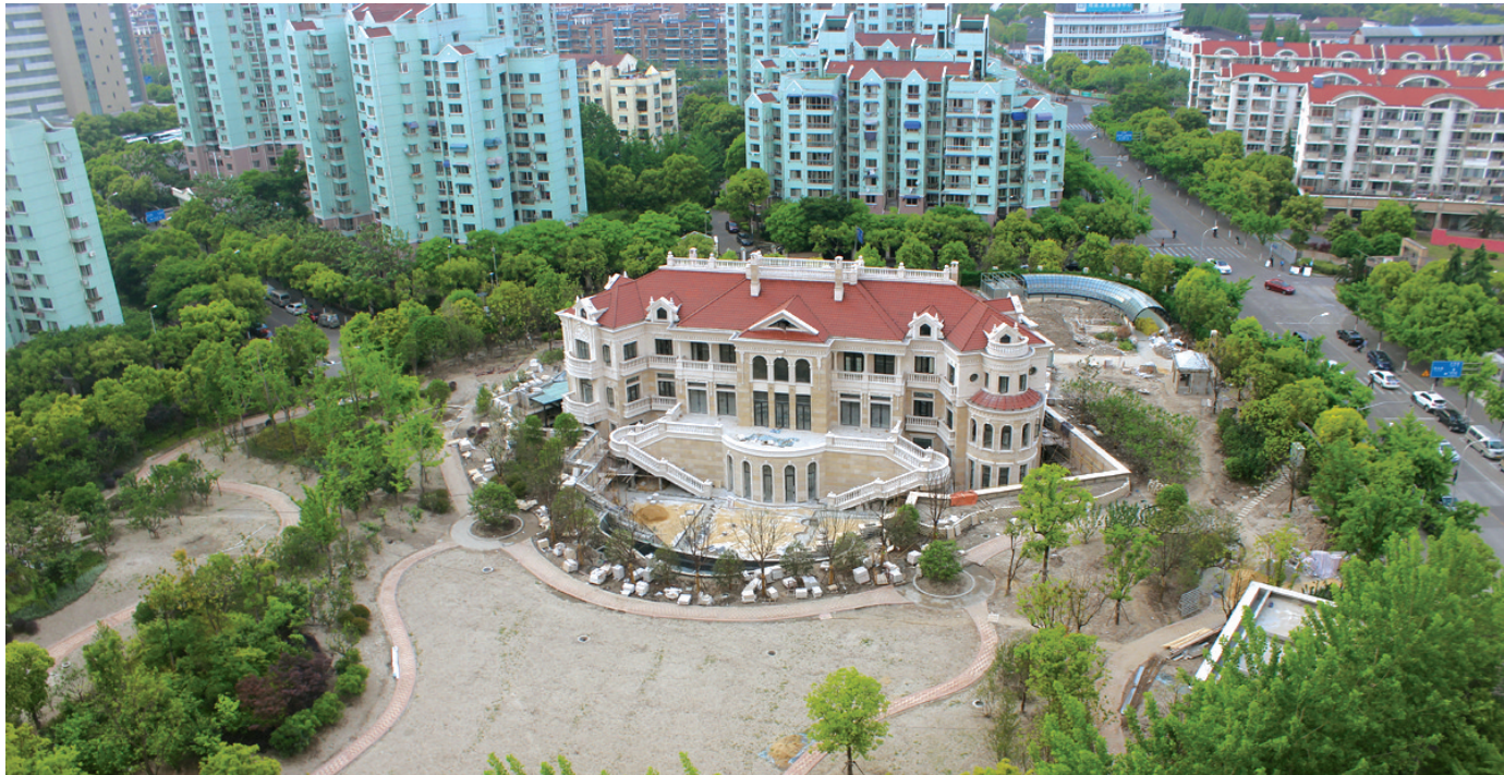
绿树环绕中的“豪宅”，显得格外气派