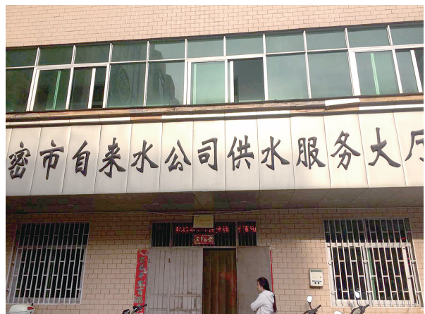
新密市自来水公司供水服务大厅