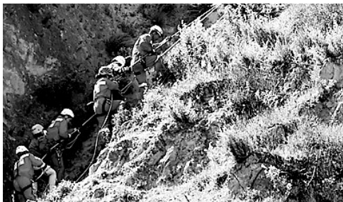
山体滑坡现场,消防战士营救“受困人员”