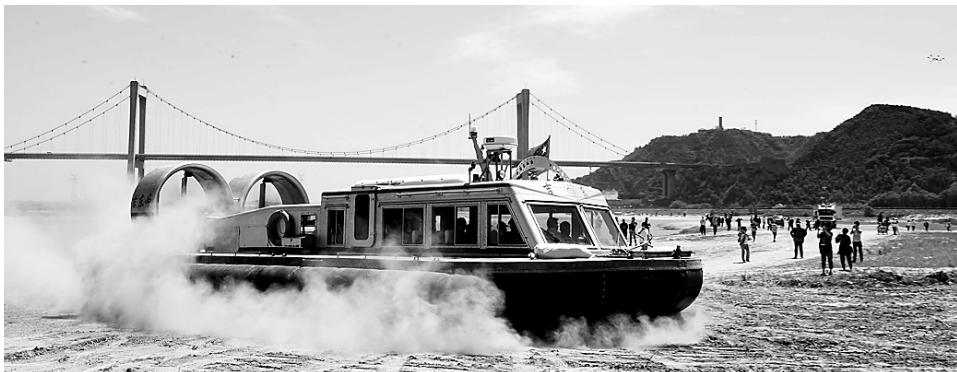
在黄河滩中被围困的“受困人员”乘坐气垫船安全转移

本报讯 昨日,是全国第七个防灾减灾日,我省一场声势宏大的军警参与、部门协同、多方联动的“海陆空”全方位立体式应急救援综合演练在郑州黄河风景名胜區桃花峪黄河滩地隆重上演。