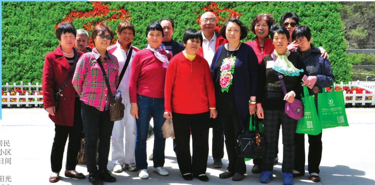
金印阳光社区老人山下合影