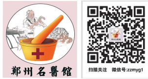
郑州名医馆 扫一扫 关注郑州名医馆