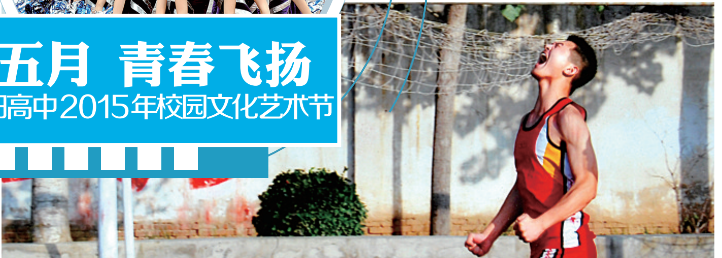
崔博文摄影作品《奔跑》