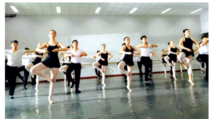
两支队伍排练舞蹈