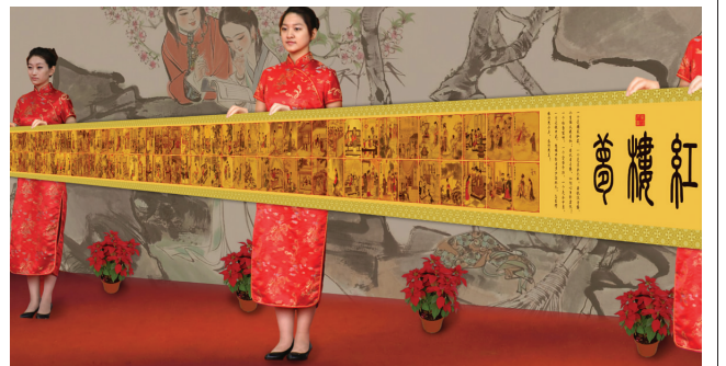
▲画心约730x28cm;裱后约800x36cm;图供参考,以实物为准

2011年,面值10000元的《水浒传》(忠义堂)圆形金币,如今最高市值100万元;2003年,面值2000元的《西游记》(大闹天宫)方形金币,如今最高市值72万元;2015年,相面值50元的《红楼梦》(共读西厢)也必将价值不菲!