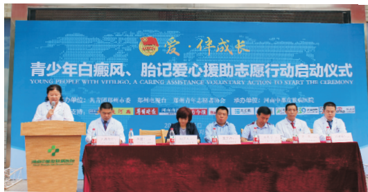
河南青少年白癜风、胎记爱心援助志愿服务行动启动仪式开幕

活动设立河南省青少年白癜风、胎记公益援助基金，主办方河南中都皮肤病医院共筹集援助专项基金50万元，用于儿童、青少年白癜风、胎记患者慈善救助，符合条件的患者每位援助3000~10000元。共青团郑州市委、郑州青年志愿者协会、郑州电视台将对此次活动的公正性、透明度进行监督，使活动更加公平、公正、公开，使公益基金切实用到青少年白癜风、胎记患者的救助上。