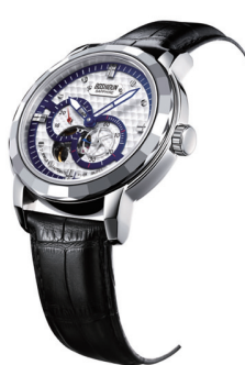
市场价 11800 元 / 只 直销价 2540 元/只