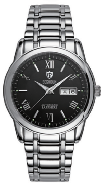
市场价 6980 元 / 只 直销价 1576 元/只