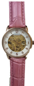
市场价 7720 元 直销价 1724 元