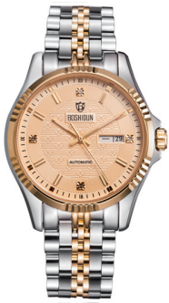
市场价 9500 元/只 直销价 1900 元/只