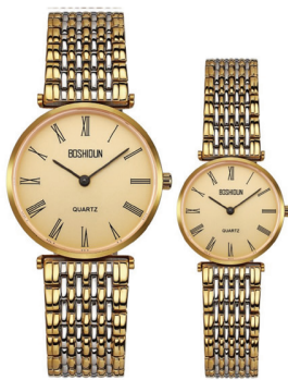
市场价 2280 元/只 直销价 480 元/只