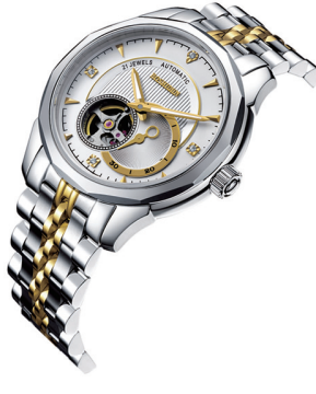
市场价 9900 元 直销价 2160 元