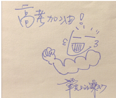
井柏然的手写微博开始于去年5月