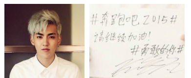
吴亦凡的字是这样的