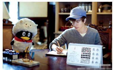
郭敬明的字入了汉仪字库。