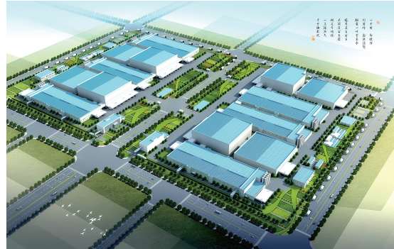
康师傅新面厂项目效果图