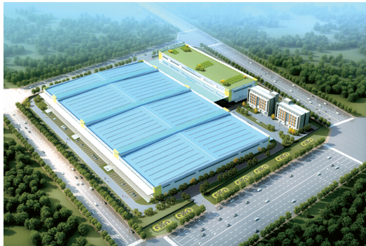
苏宁物流园效果图