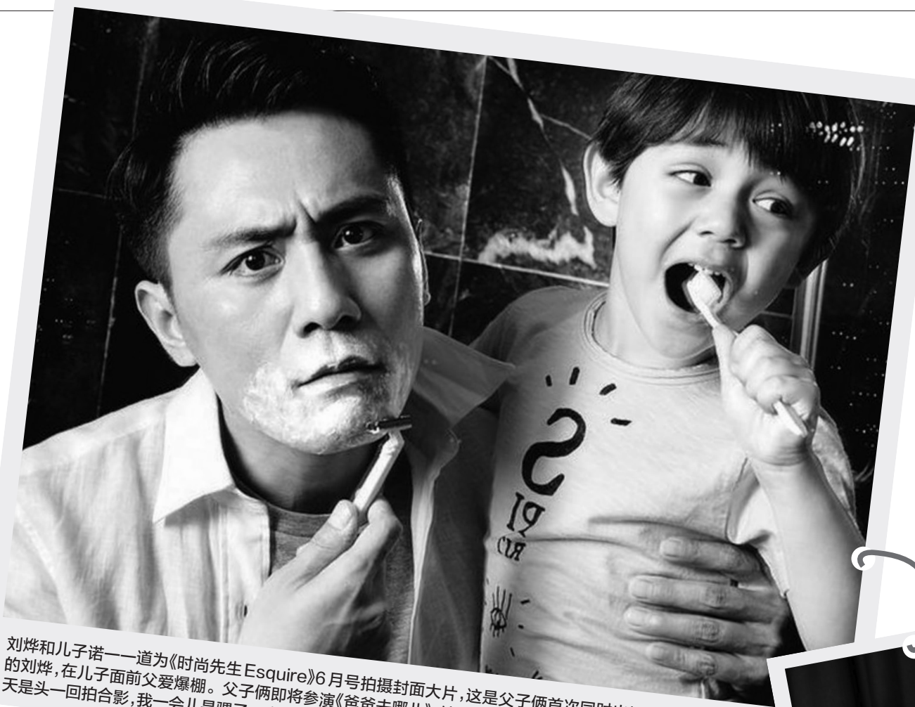
刘烨和儿子诺一一道为《时尚先生 Esquire》6月号拍摄封面大片,这是父子俩首次同时出镜。平日里酷帅的刘烨,在儿子面前父爱爆棚。父子俩即将参演《爸爸去哪儿》,这回拍大片算是提前彩排了,刘烨笑言:“今天是一回拍合影,我一会儿是骡子一会儿是马,爷儿俩得往上冲了。”

昨天六一儿童节,不满14岁的少年儿童全都放假一天,这可苦坏了不放假的“大龄儿童”——他们的家长。