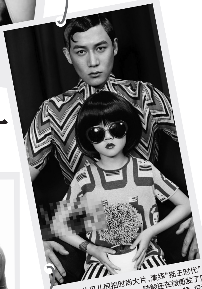
陆毅和女儿贝儿同拍时尚大片,演绎“猫王时代”,重温“美国往事”。昨天六一,陆毅还在微博发了贝儿照片,借女儿口吻说:“今天好好大吃一顿,祝我节日快乐!”