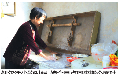
偶尔活少的时候,娘会早点回来擀个面叶。