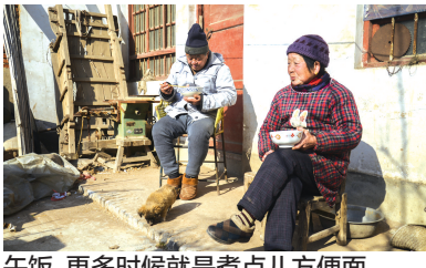
午饭,更多时候就是煮点儿方便面。