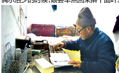
晚饭后,爹帮娘记账,看她一天挣了多少钱。

“豫览视界”摄影俱乐部是郑州报业集团“图片银行”所属的图像拓展平台项目的重要互动形式。俱乐部主要有摄影比赛、集中采风、讲座交流、图像价值评估等系列市民摄影活动。其中微摄影比赛活动定期举行,获奖作品将择优在《郑州晚报》刊登并通过官方微信号“豫览”展示交流,获奖者还将获得丰厚奖品!