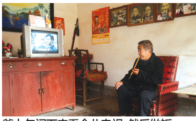
爹上午闲下来看会儿电视,然后做饭。