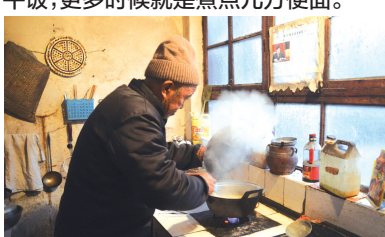
午休醒来,爹就开始早早地做晚饭了。