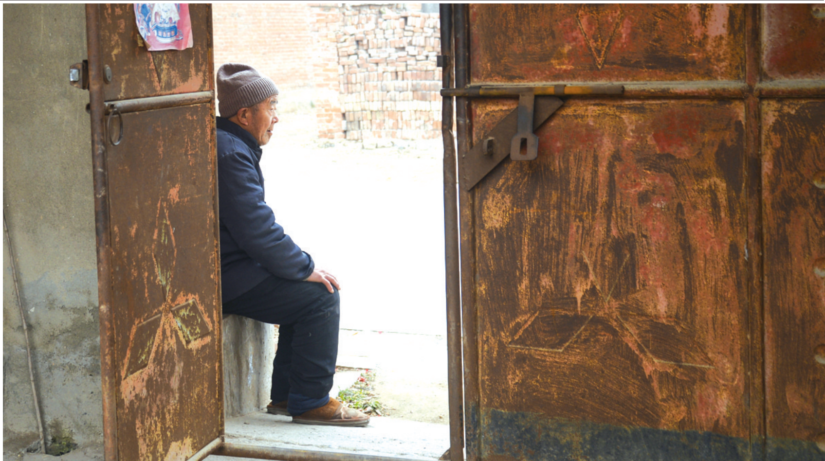
饭做好,爹每天会雷打不动地坐在门口等着娘回来。