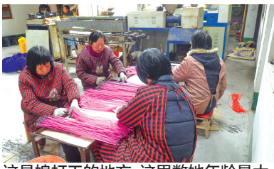
这是娘打工的地方,这里数她年龄最大。