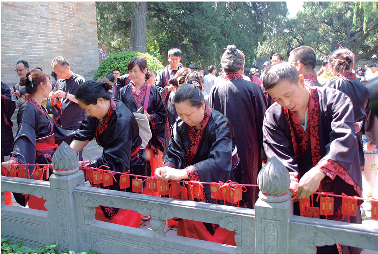
5月30日,登封市嵩阳书院内,钟声划破寂静,百名高考学子亲友团身着汉服、手拿祈福牌、拜孔子,为高考学子祈福。据嵩山景区负责人介绍,此次活动旨在通过孔子体现儒家的情怀,彰显嵩阳书院的治学精神,寓教于乐、劳逸结合,为中高考学子祈福加油。同时,也让人们更好地了解嵩阳书院的历史文化,将博大精深的儒学精神传播开来。本周末,又到一年高考季。在此,本报预祝所有高考学子金榜题名。记者 袁建龙 登封播报 刘俊苗 通讯员 张晓梅 文/图