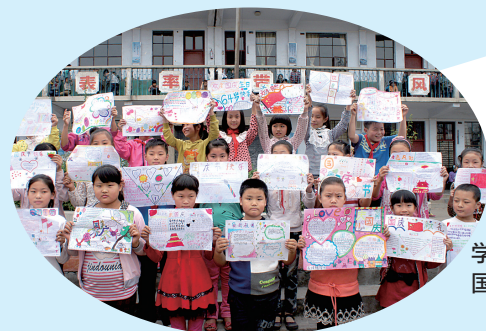
学生展示 国庆手抄报