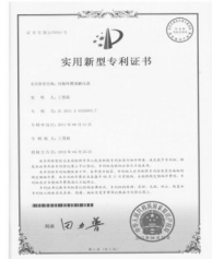
重大发明专利证书