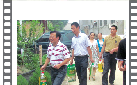
国土局班子成员去东风路办事处孟庄村慰问贫困户