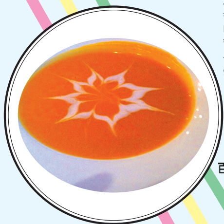
百堡湖畔红酒餐厅

地址:郑东新区商务内环路国际会展中心6号门 电话:13523516060 营业时间:14时~22时 公交线路:23路、26路、206路、919路