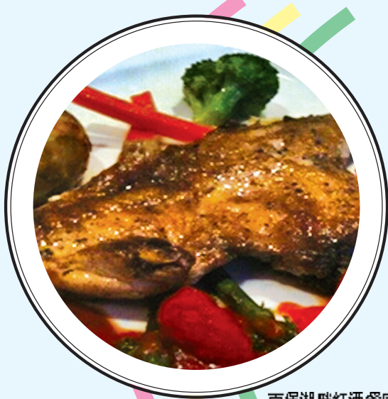
百堡湖畔红酒餐厅