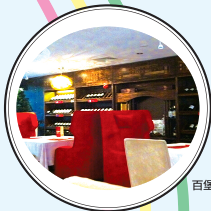
百堡湖畔红酒餐厅